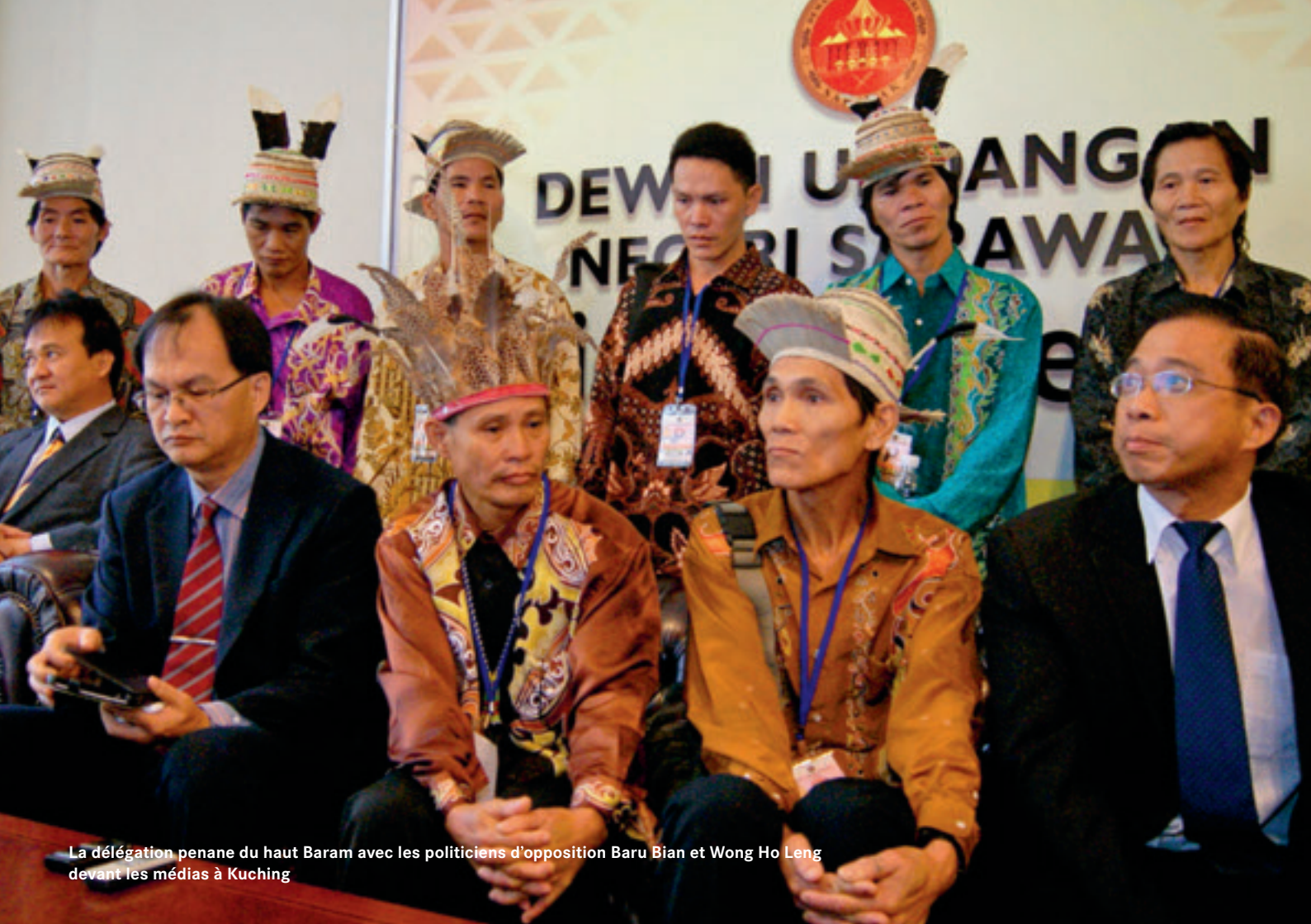
La délégation penane du haut Baram avec les politiciens d'opposition Baru Bian et Wong Ho Leng devant les médias à Kuching